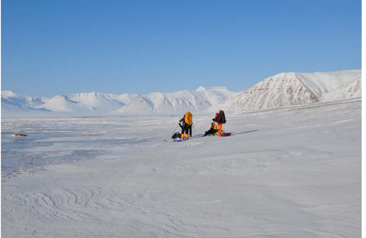
Диксонфьрд и Диксондаллен