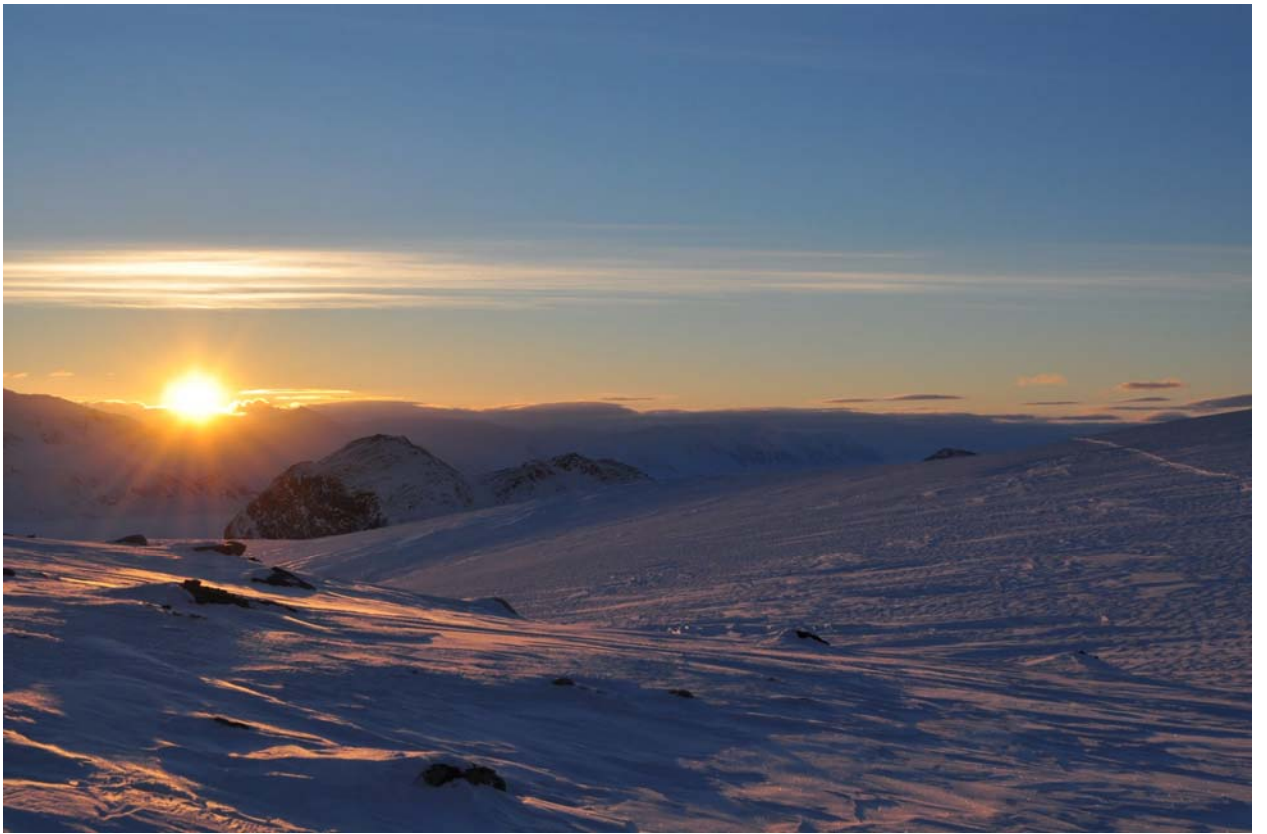
Закат на Миттаг-лефлер.