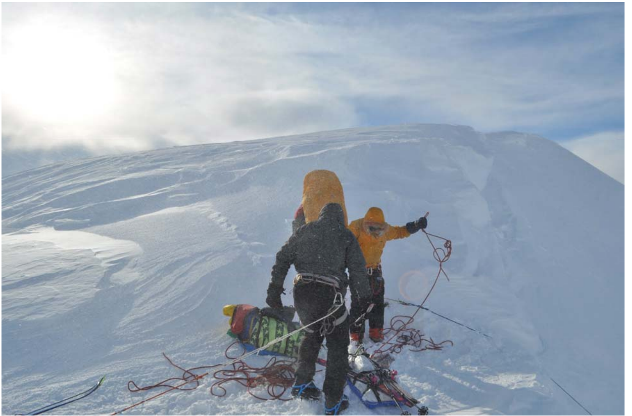
По быструхе дюльфераем