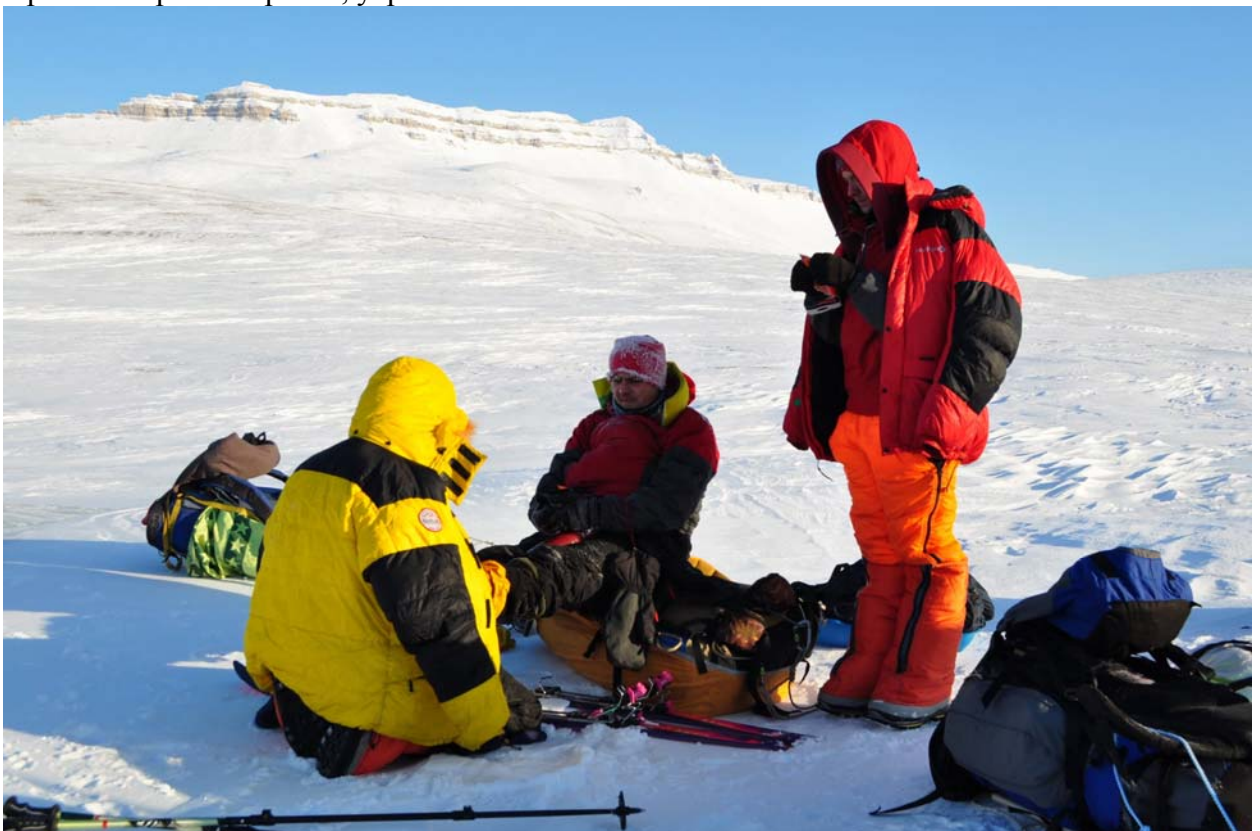
За первый переход наш процентник не смог отогреть ноги в своих пластах, поморозился, срочно грею его пальцы у себя на брюхе. Люди, сколько вам говорить? Не ходите в пластах в лыжные походы!