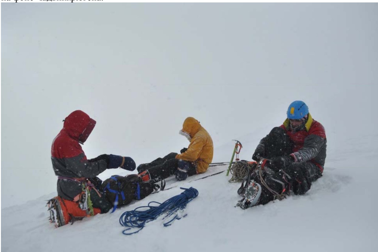
С утра пуржит