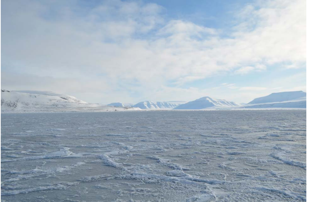
Темпелфьрд замерз совсем недавно, снегопада еще не было.