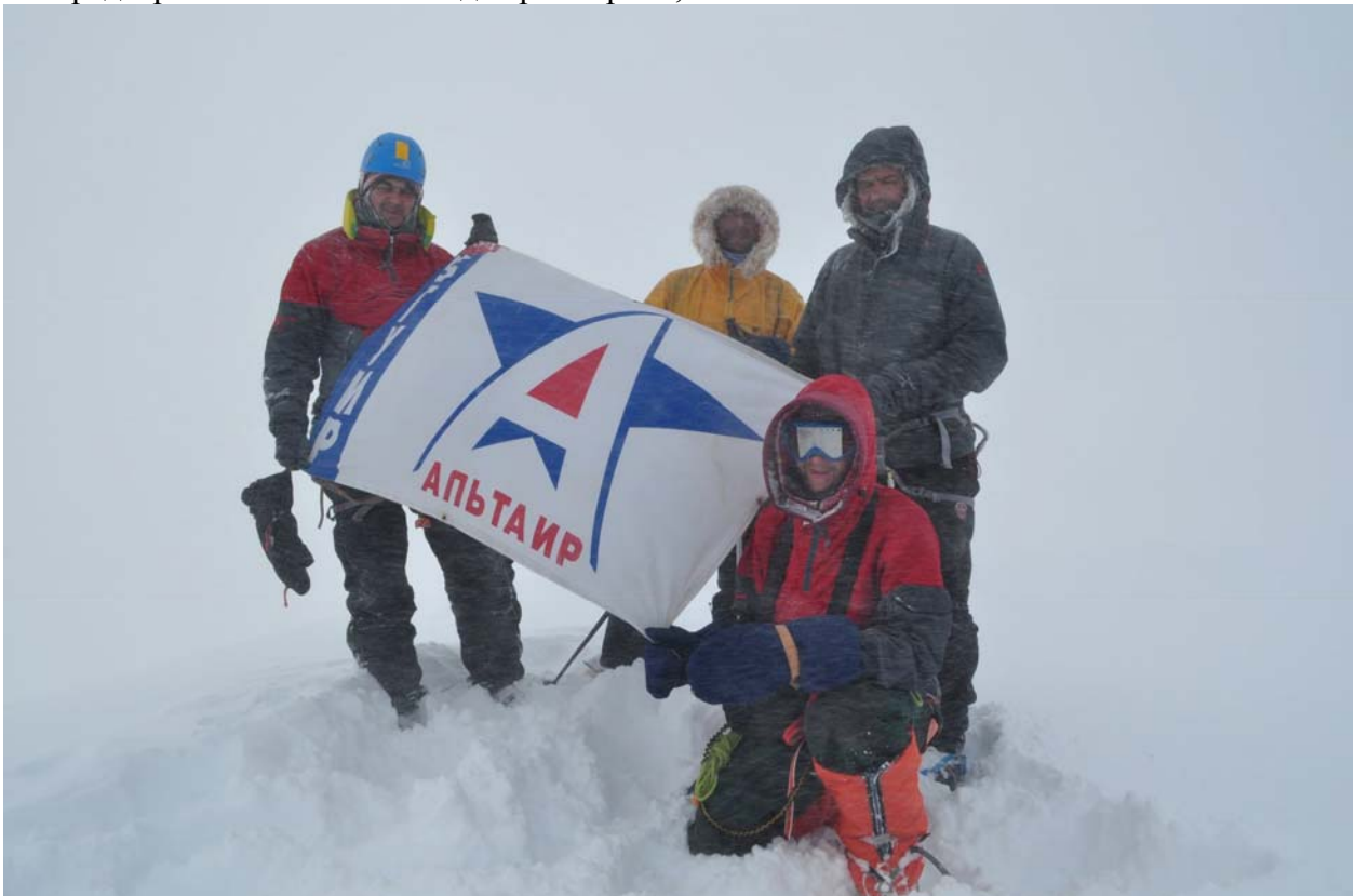
Пик Перье высота 1713