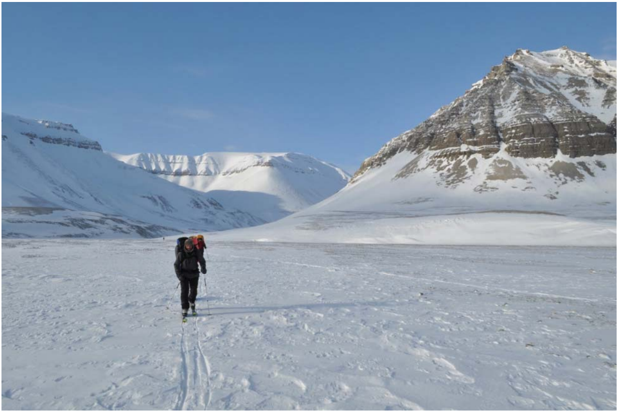
Прощальный взгляд назад.