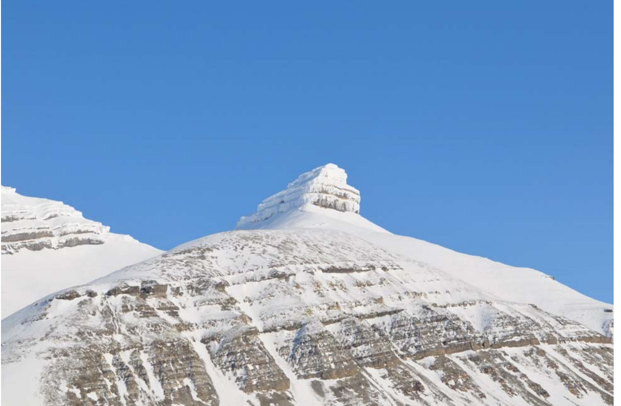
А здесь другой тип рельефа.