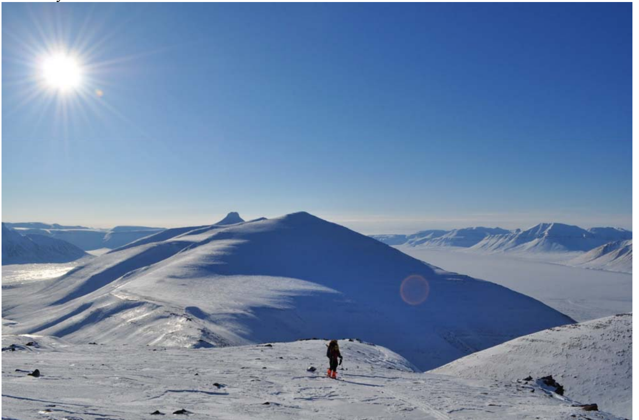
Не спускаясь к фьерду траверсируем вершину до следующего перевала углубляясь в горы