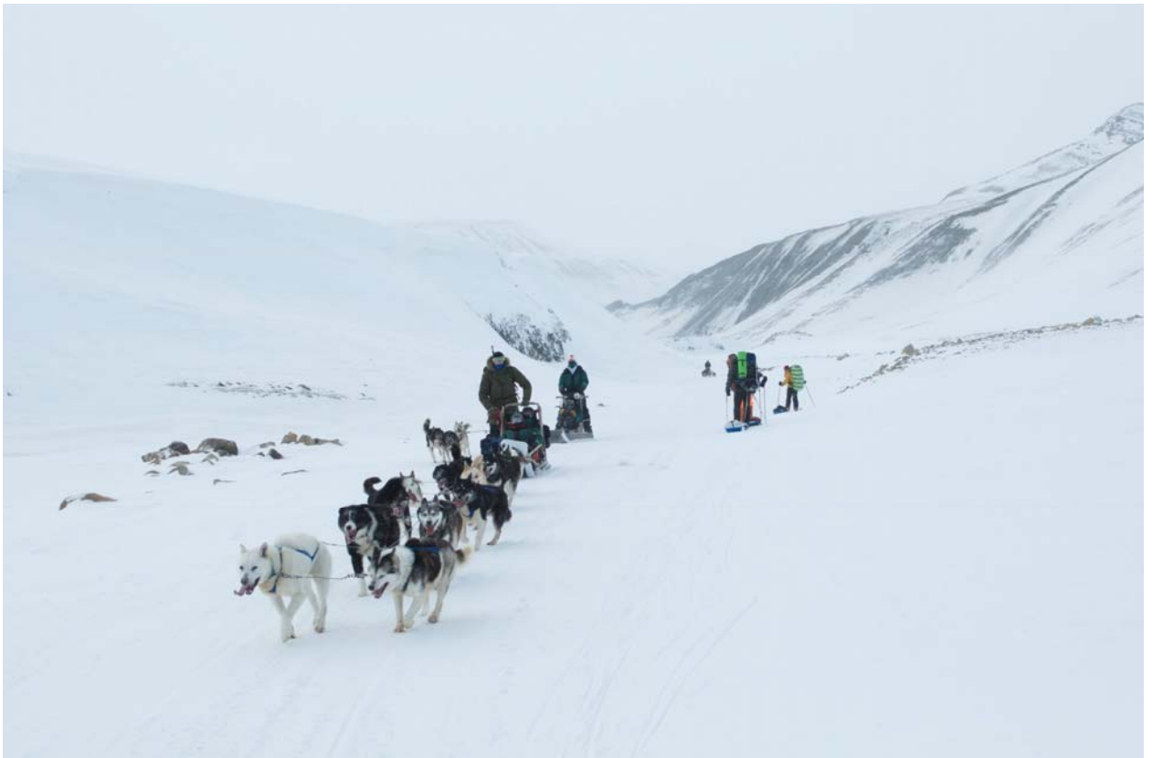
Стали попадаться буранка и собачьи упряжи с прогуливающимися пенсионерами.