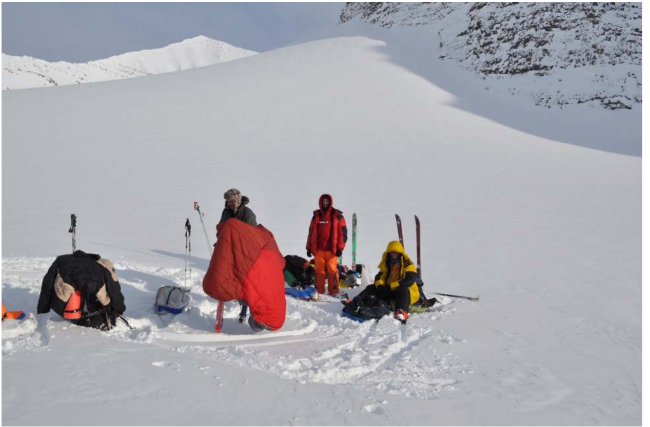
А с этой стороны штиль и красота