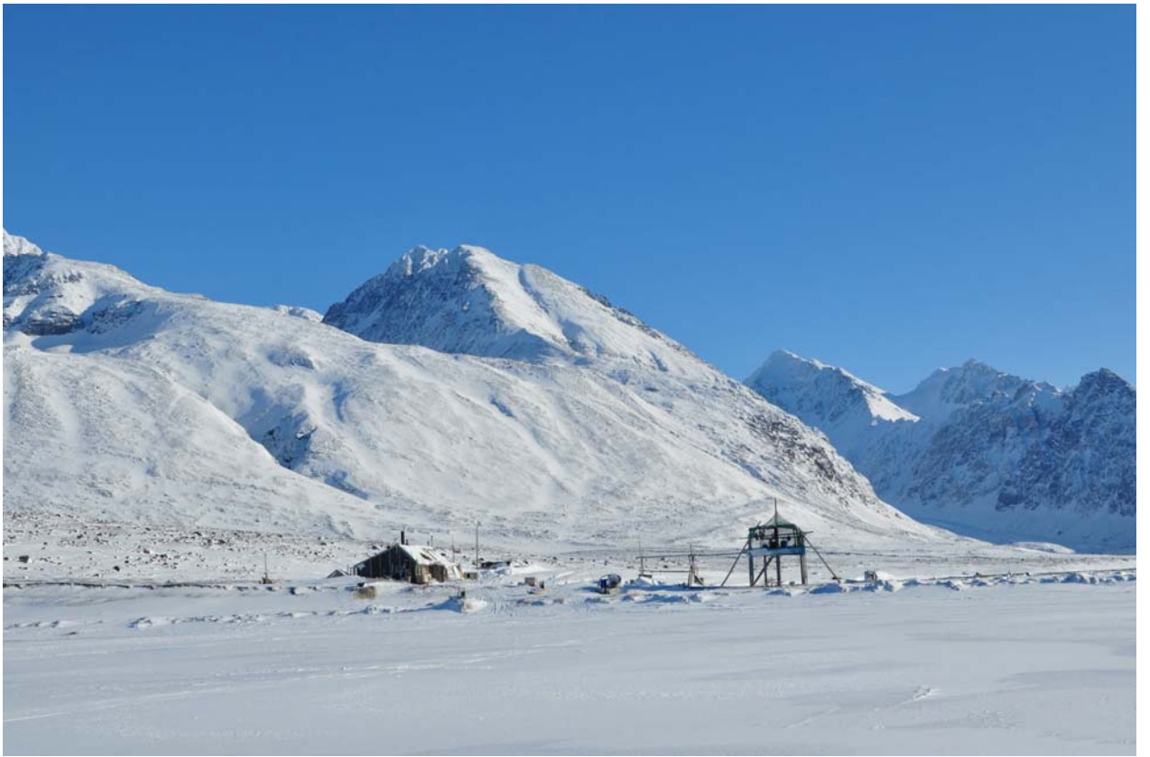
И взгляд вперед, хижина Эусхутта