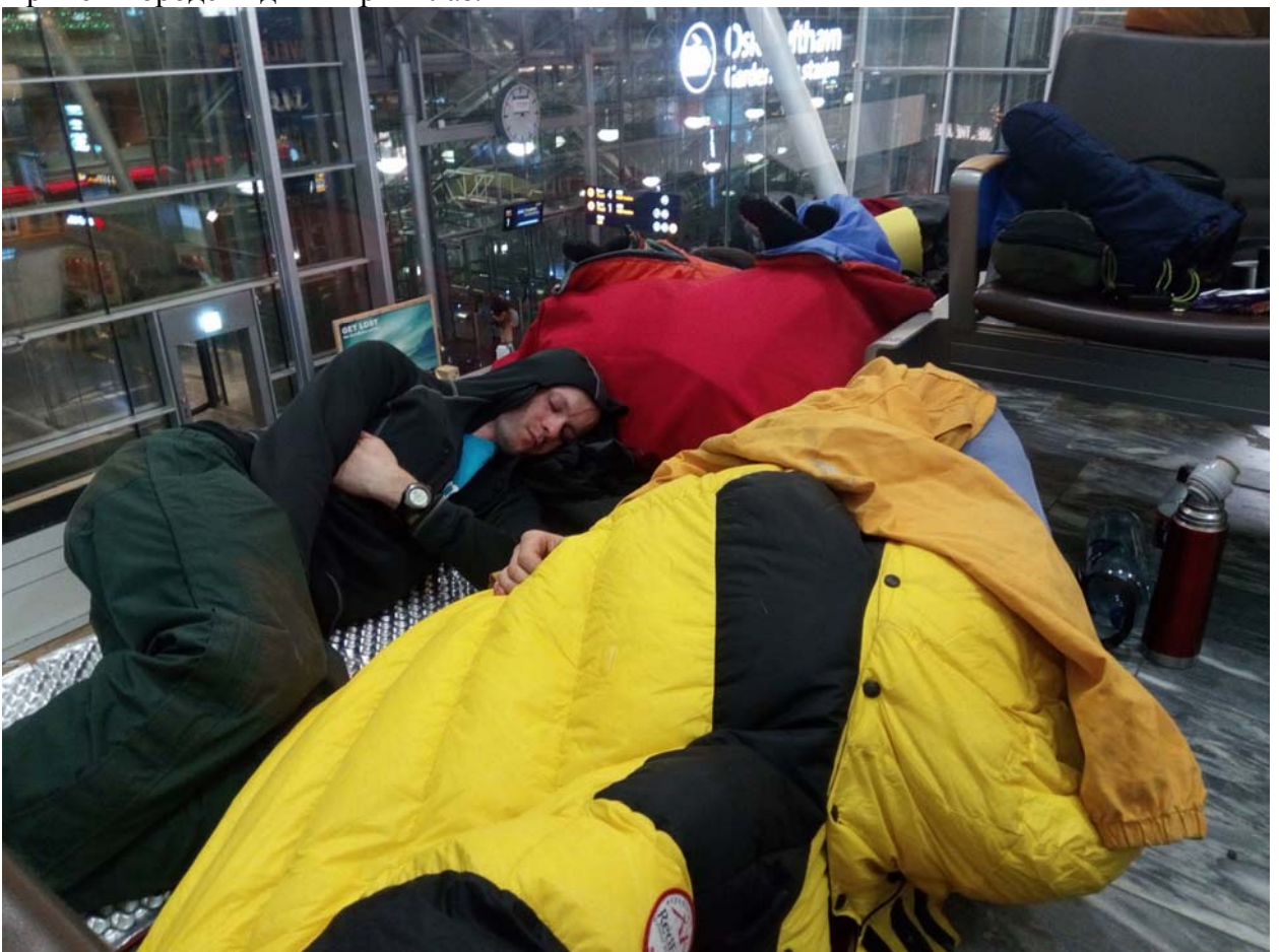
Привычный сон в аэропорту Осло и мы почти на Родине.