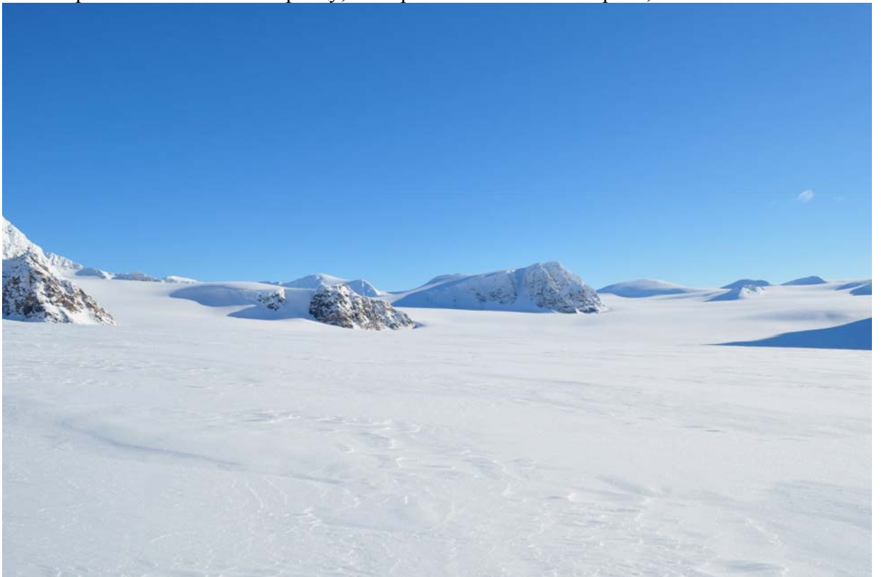
Виды тут как в Антарктиде.