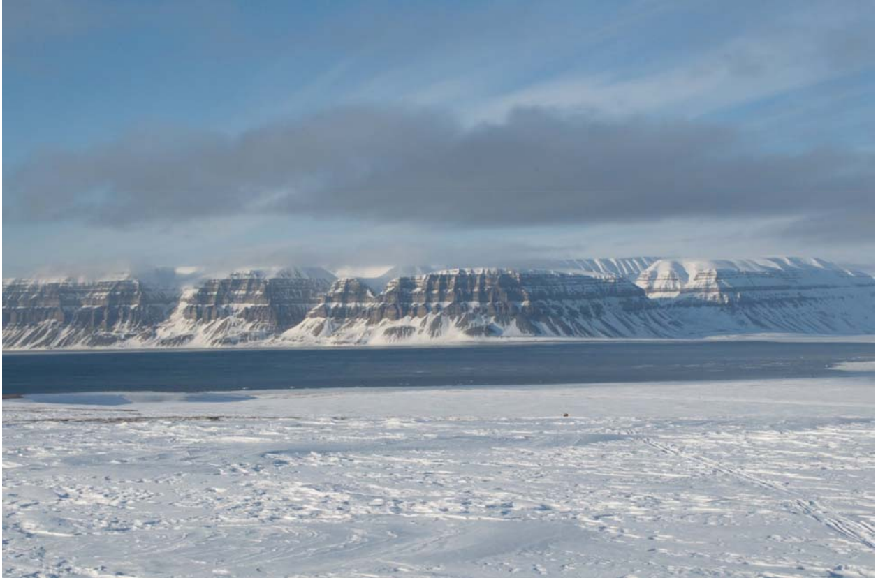
Вид назад через Сассенфьрд.