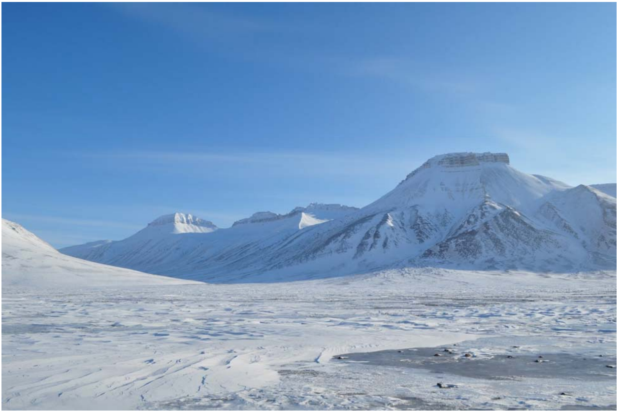
Виды по дороге