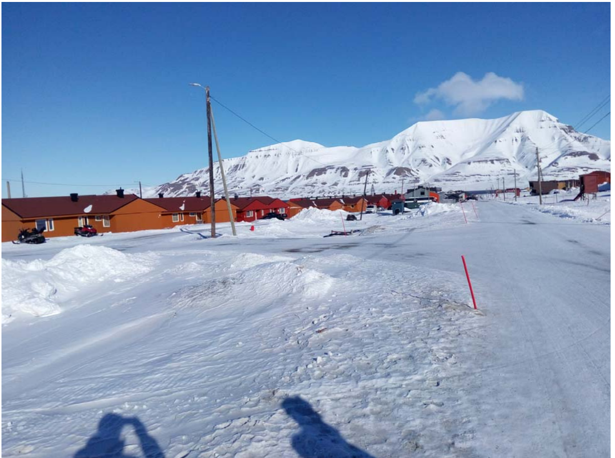
Прямо в городе виды –вырви глаз.