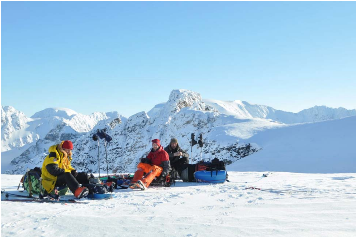
Встали раненько чтобы по морозцу, на перевале солнышко согрело, назвали его Панки.