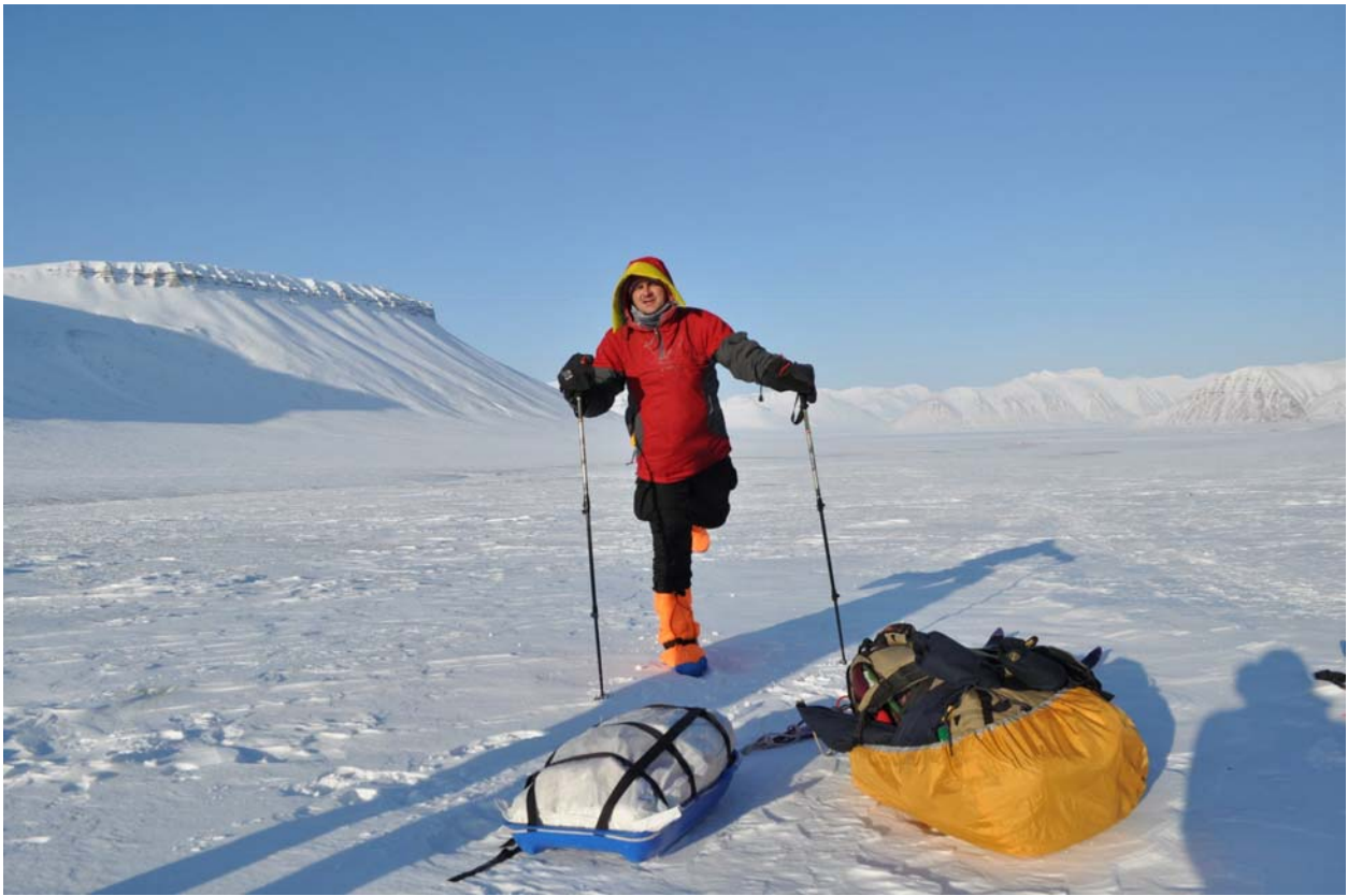
Отмахивается, поздно пить боржоми...