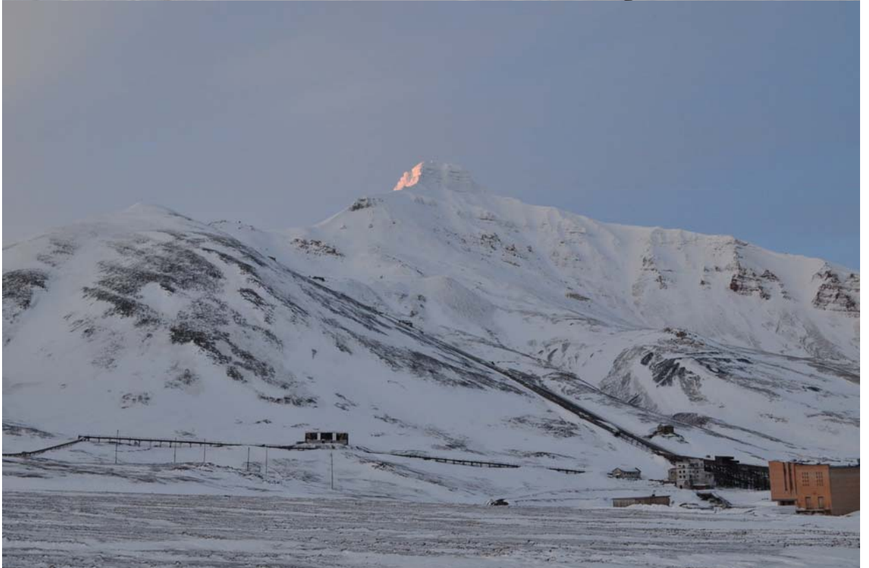
Пирамида гора на закате.

К слову сказать, с этого дня солнце уже не заходило, спать тяжело, пришлось шапку натягивать до носа и накрываться конденсатником, иначе не ночь ни разу. Однажды я будучи дежурным проснулся и глянув на часы стал готовить завтрак, всё сделал и перед побудкой команды еще раз взглянул на часы, тут закралось сомнения, понажимал кнопки –оказывается 3:15 в реалии, пришлось заворачивать клаву в «бабу» и дрыхнуть еще 2 часа.