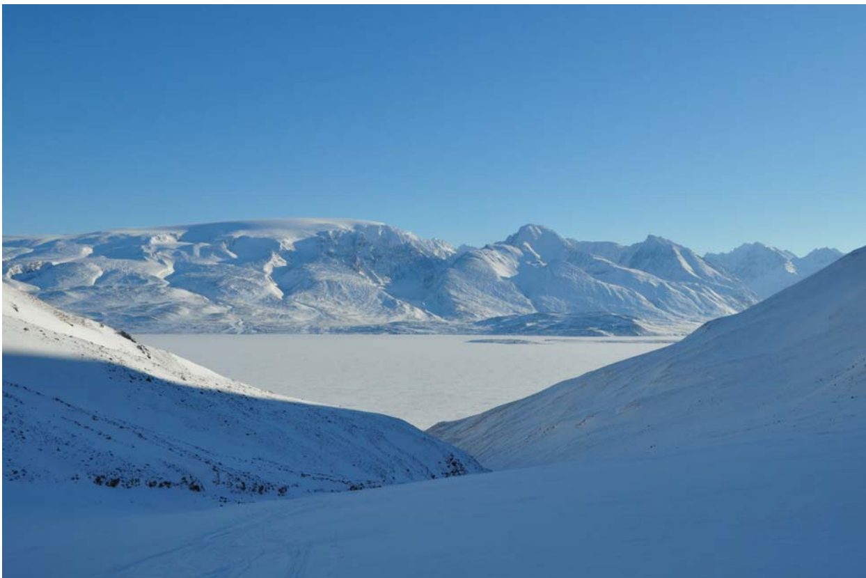
Восточный борт Эусфьерда, спускаемся к нему