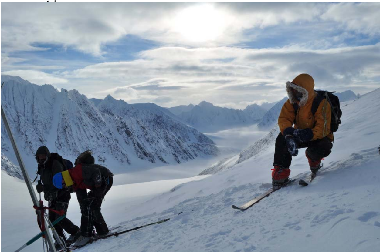
А гор там нехоженных еще пруд пруди.