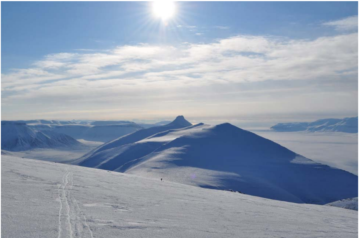
Отставший человек – медвежьи консервы