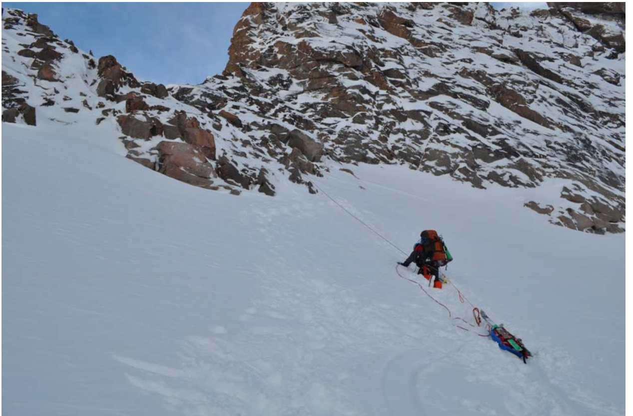
На подъеме к перевалу Зуб Дракона глубокий снег, на спуск полторы веревки по стенке.