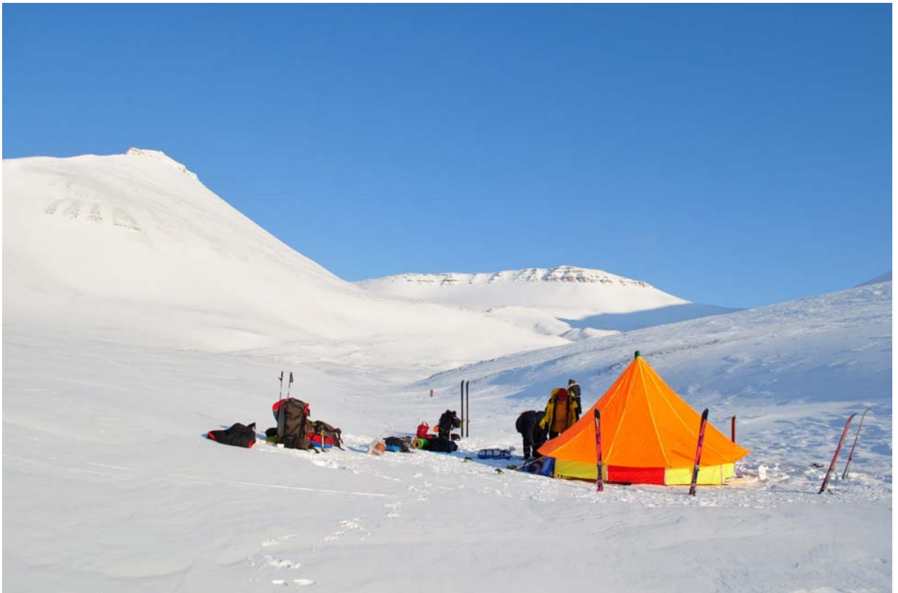
Прошли первый перевал, утро.