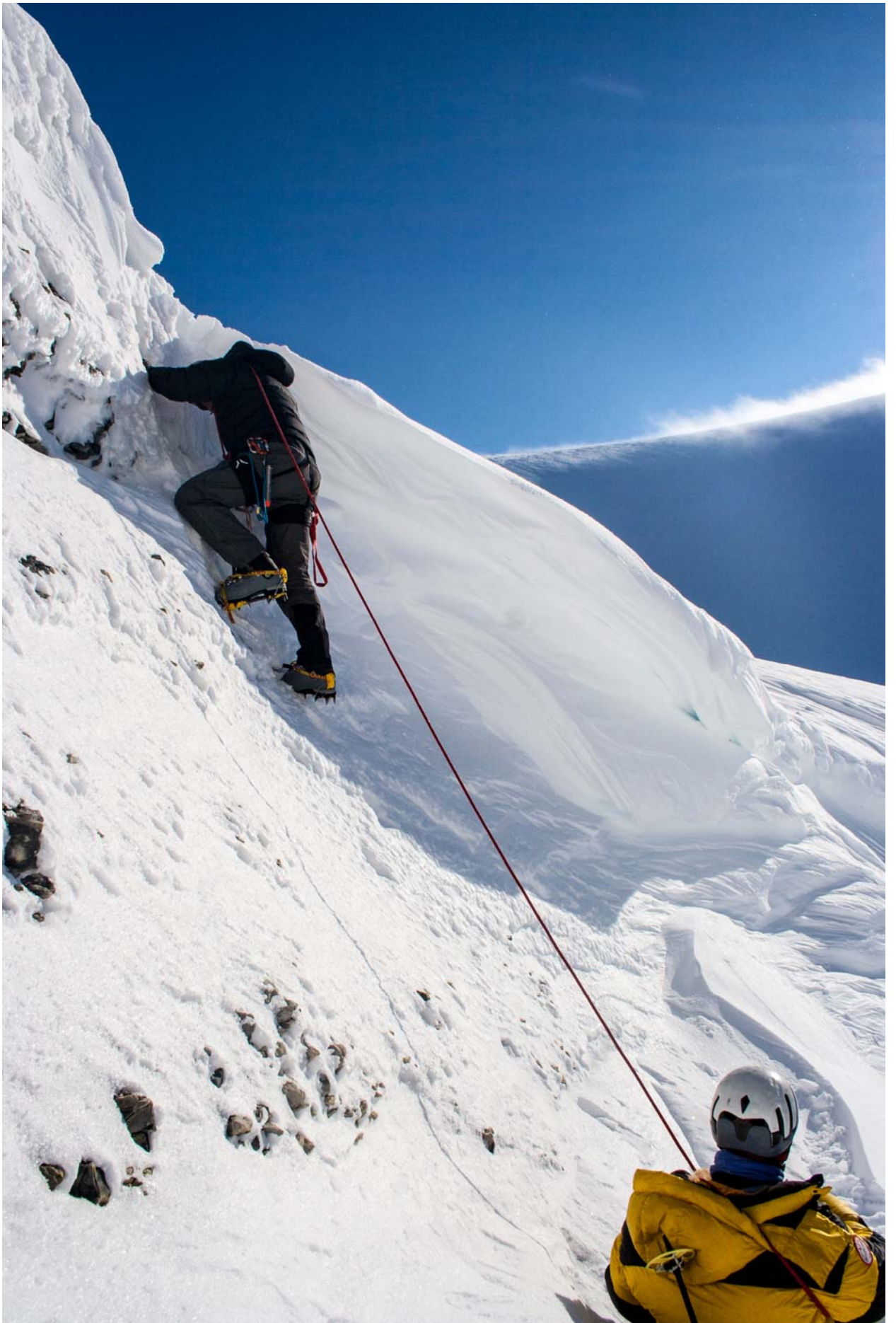
Финальный взлет пришлось лезть без рюкзака, так что на 2Б тянет.