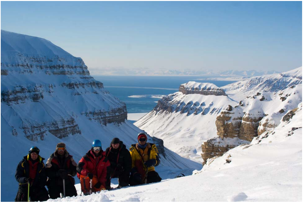
Вдали виднеется открытая вода Сассенфьерда