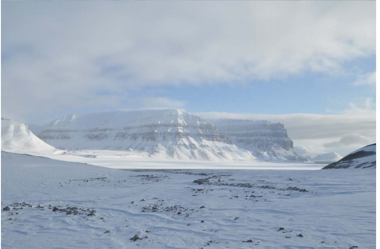
Выход в долину, противоположный борт высится как океанский лайнер.