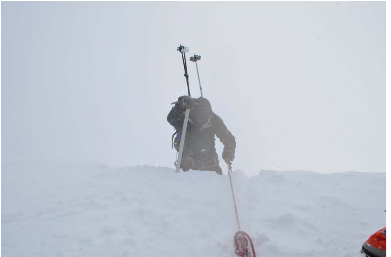
На предвершинное плато выход через карниз, лавиноопасно.