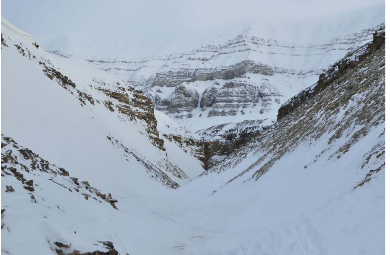
Заход в долину Маклейн проходит через узкий каньен.