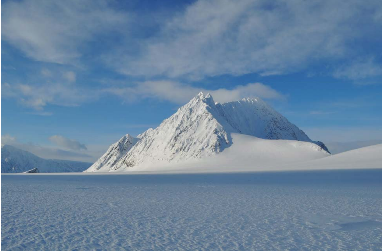
А дальше горы, вершины, стены.