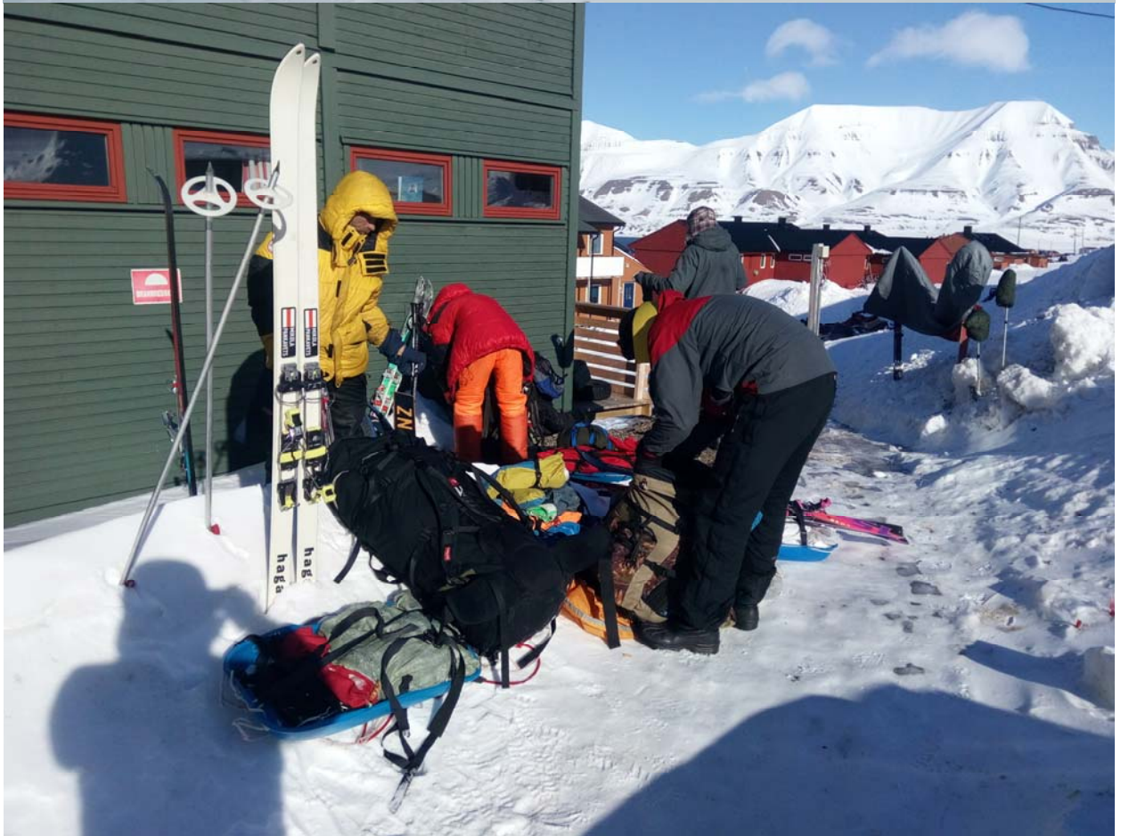
Вот почти и дома.