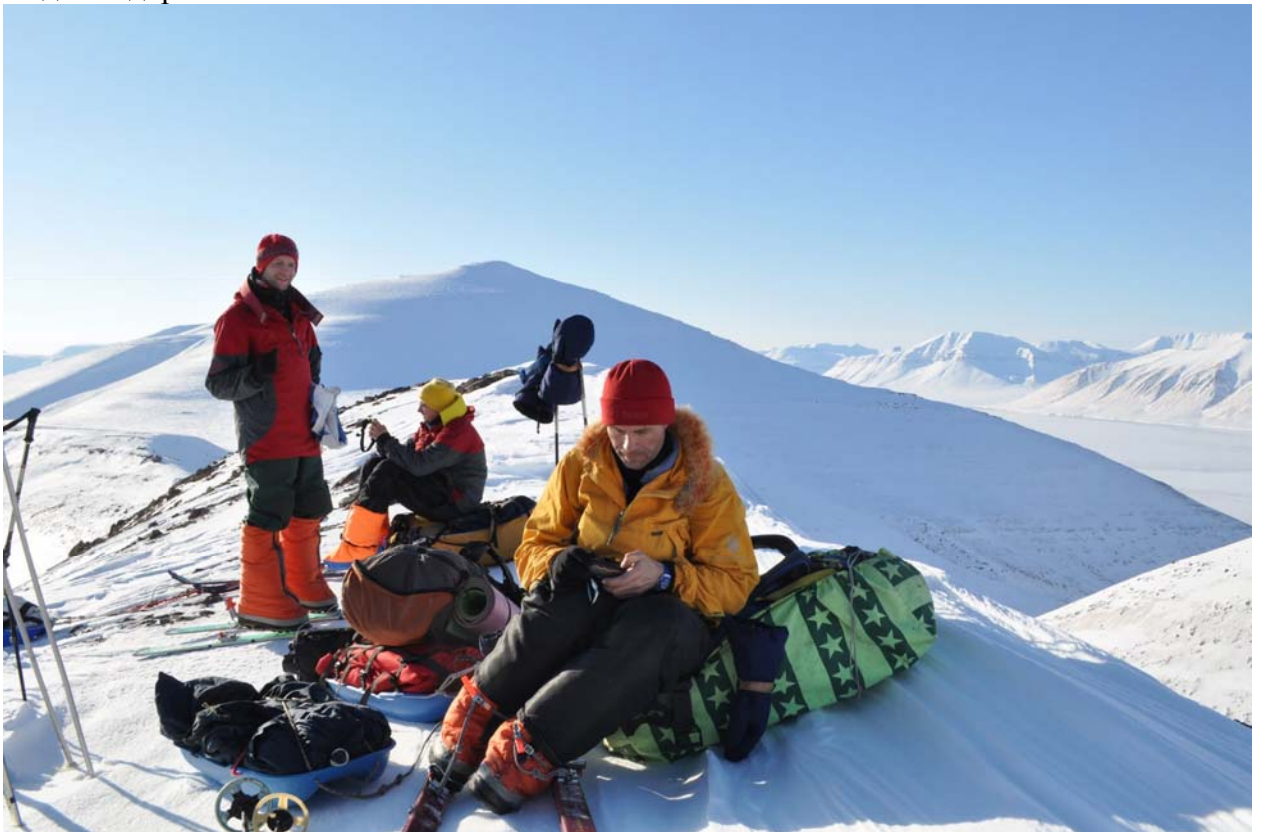
Еще один перевал к Диксону