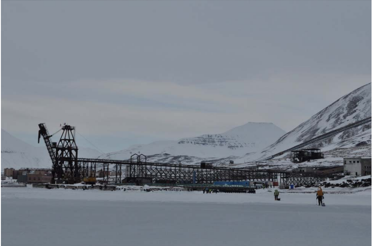
Вернулся местный начальник Петр, завез буржуев на автобусе и за нами на пикапе