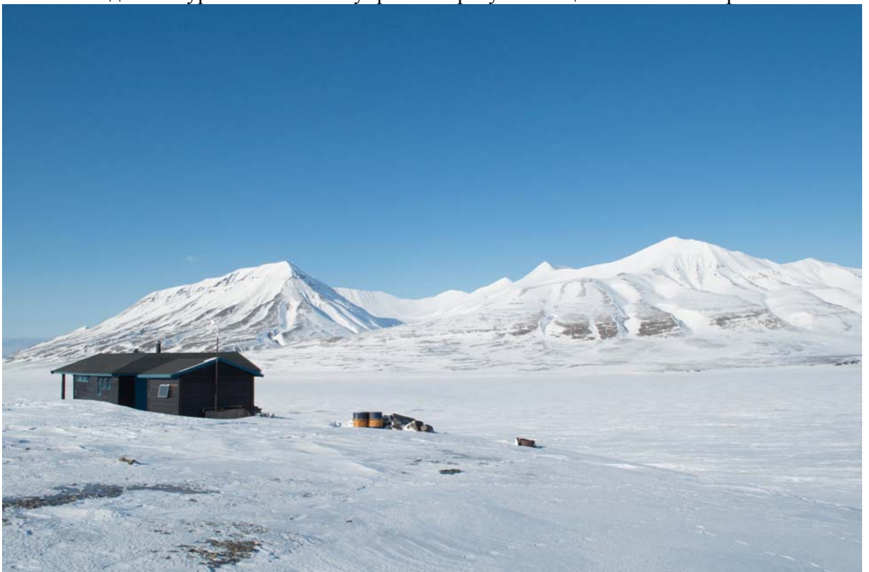
Долина Адвент то тут, то там наполнена дачными домиками.