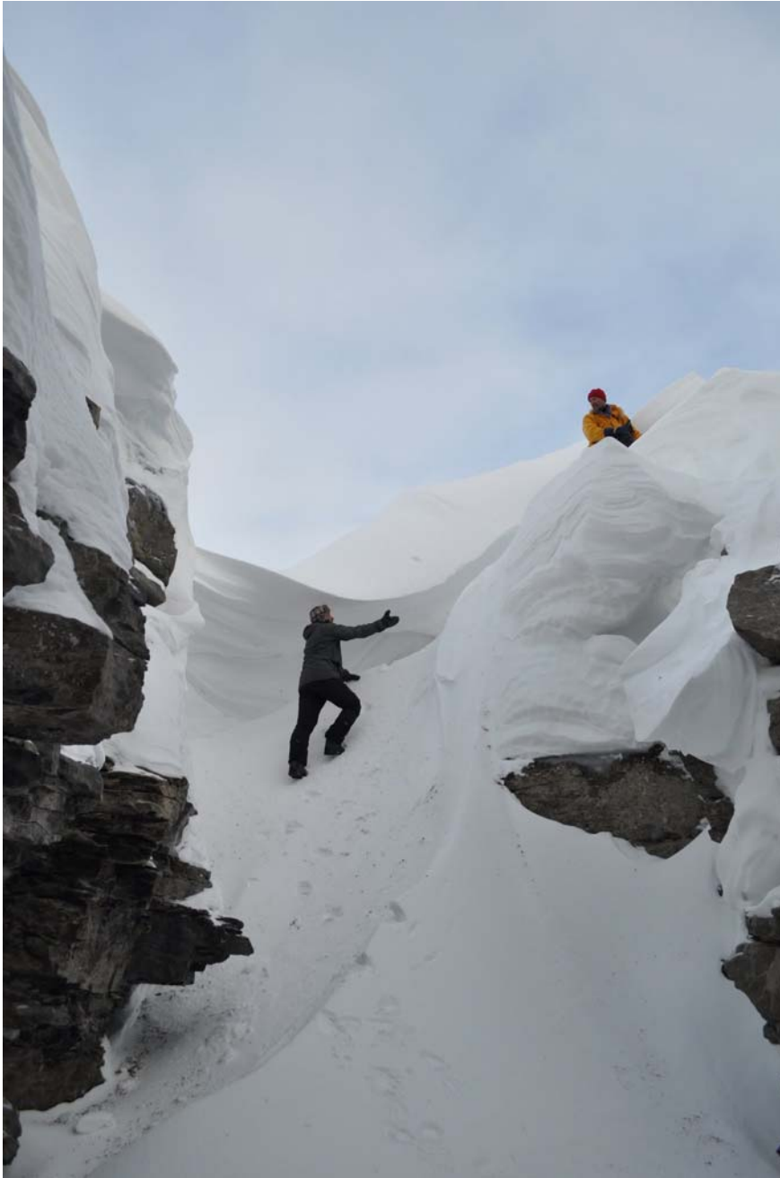
Каньен заканчивается фирновой пробкой, приходится снимать лыжи и карабкаться наверх.