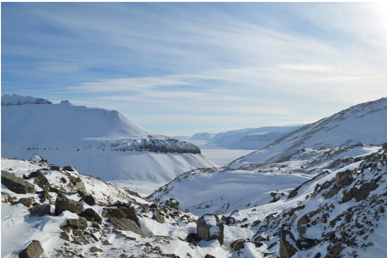
На спуске с Хуткого. Виднеется исток Темпелфьрда и вдали ледник Ломоносова.