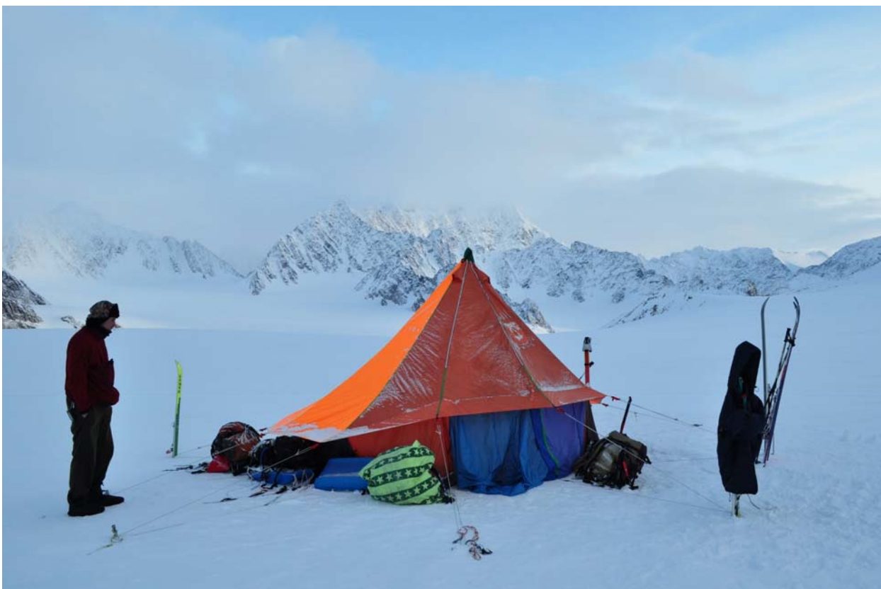
Погода испортилась, но мы дошли как и планировали к подножью Перитоппена. Палатка на фоне Чадвикрюгена.