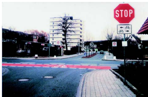
Что важно для велосипедистов: надежные и привлекательные дороги.

Федеральное министерство транспорта, строительства и жилого фонда подготовит проект изменения Правил допуска транспортных средств к движению (StVZO) в такой срок, чтобы оно могло вступить в силу уже в этом году.