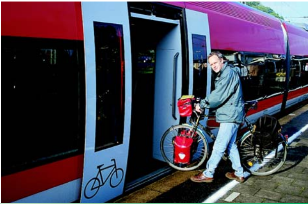
Необходимо разрабатывать дружелюбные пассажирам правила провоза.