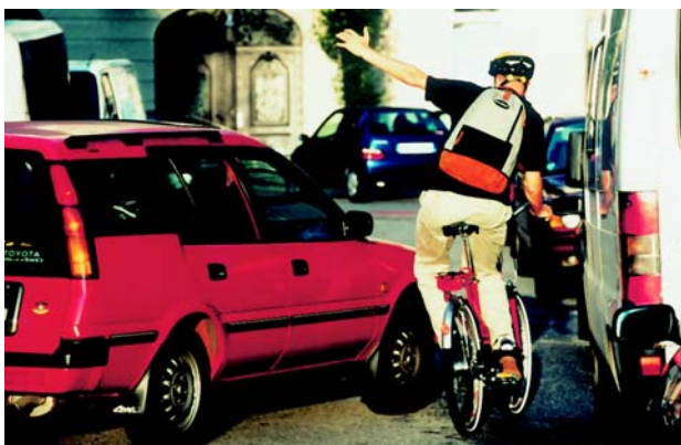
Каждый отдельный гражданин должен вносить вклад в транспортную безопасность

Каждый отдельный гражданин должен чувствовать себя обязанным вносить вклад в транспортную безопасность за счет своего соответствующего поведения – как посредством соблюдения правил движения, так и компенсации ошибок других своим защитительным, предусмотрительным поведением (§ 1 Правил дорожного движения (StVO): постоянная осторожность и взаимная предупредительность). Кампании по укреплению осознанного транспортного поведения должны с применением специфических для разных целевых групп стратегий быть обращены ко всем участникам дорожного движения: к велосипедистам и пешеходам всех возрастных групп, а также к водителям автомашин. На основе полученных в исследовательских проектах данных для сферы транспортного воспитания и просвещения могут быть выведены следующие меры для улучшения транспортной безопасности и транспортного климата (Обзор 24).