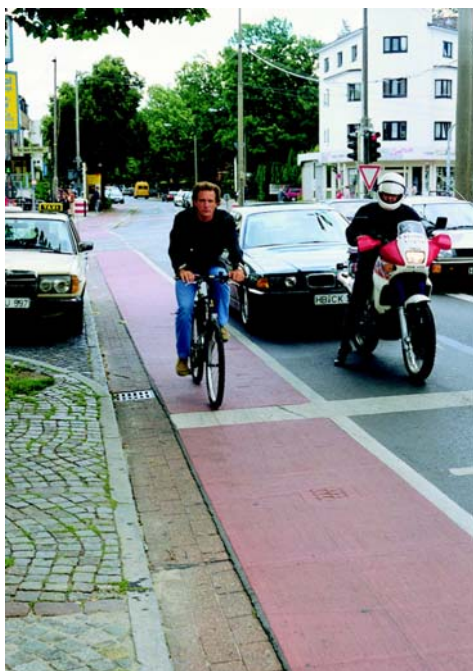
Многие города Германии уже проявили многочисленные и разнообразные инициативы в аспекте долгосрочной транспортной политики.

Многие города Германии уже проявили многочисленные и разнообразные инициативы в аспекте долгосрочной транспортной политики. Во многих городах и коммунах прогресс уже настолько значителен, что осуществленные там меры и проекты могут считаться примерными. Избранные проекты приведены в Приложении 1 к Национальному плану развития велосипедного транспорта. Хорошие примеры должны подвигнуть всех двигаться далее по выбранному пути.