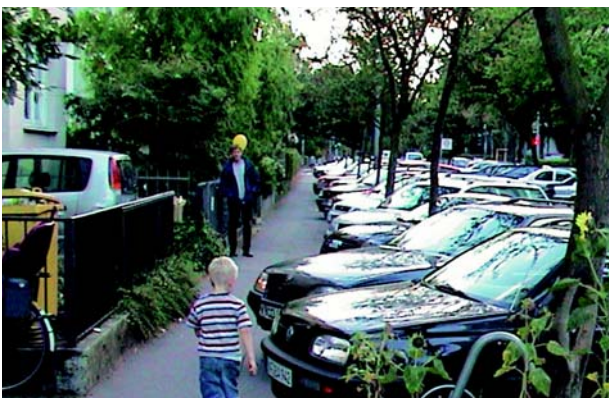
Припаркованные автомобили занимают большую площадь, ухудшают качество жилого пространства.

Преимущество велотранспорта – как в экологическом, так и в градостроительном аспекте – его сравнительно небольшая потребность в площади, которая в 5-10 раз меньше соответствующей потребности автотранспорта. Именно для того, чтобы полностью использовать это преимущество, необходимо долгосрочное и систематическое учётывание велосипедного сообщения в транспортной политике, территориальном планировании и градостроительстве. Это позволит отказаться от перестройки или достройки транспортных площадей и извлечь выгоду из малой потребности велотранспорта в площади. Наряду с этим перепланировка улиц в интересах велосипедистов (например, посредством озеленения) улучшает облик города и за счет увеличения площадей для потенциального использования в других целях (например, для пешеходов, для открытия точек питания) улучшает качество жизни в городах.