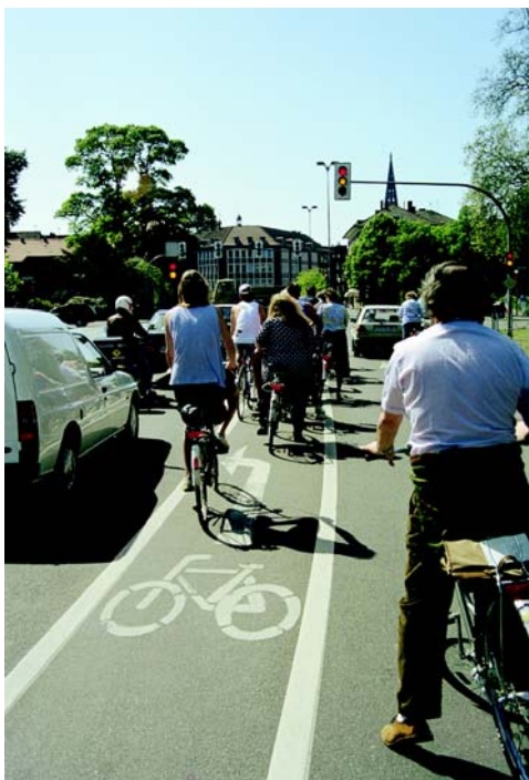
Нормы права, регулирующие дорожное движение, следует сделать удобными для велосипедистов.

Программа Interreg III В направлена прежде всего на подготовку инвестиций или небольшие инвестиции. Решения относительно проектов принимаются не в Брюсселе, а в международных административных комитетах при национальных и региональных органах территориального планирования.