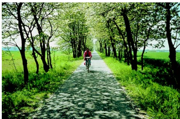
Отдых вблизи места жительства и мобильность в свободное время: необходимо создавать и развивать возможности.

В ведущем проекте «Mobinet» Федеральное министерство образования и исследований осуществляет меры программы «Bike&Ride» на трех вокзалах Мюнхена. Среди прочего там будет обустроена автоматическая гаражная парковка для велосипедов с сервисной станцией и привлекательными парковочными местами.