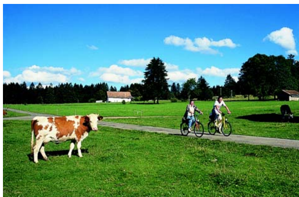
Маршруты велосипедного туризма нуждаются в туристической инфраструктуре.

Спектр услуг для велотуристов может быть очень широким. Наряду с дорожными указателями информационные щиты на маршруте могут сообщать о - маршрутах велосипедного туризма в регионе, - туристической инфраструктуре, - связях со средствами местного общественного транспорта (напр., с железной дорогой, автобусами с возможностью провоза велосипедов, водным транспортом).