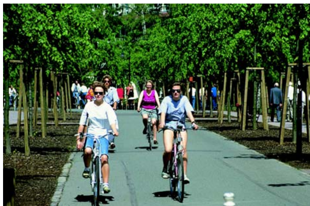
Велосипедисты и пешеходы: необходимо принимать меры для развития «Города коротких путей».

Федеральное правительство может в этом случае только установить рамки, как это было сделано при дополнении Закона о территориальном планировании (ROG) в 1982 году. Собственно реализация и интеграция этих ведущих целей территориального развития осуществляется на уровне федерально-земельного и регионального планирования, а также на коммунальном уровне за счет городского планирования.