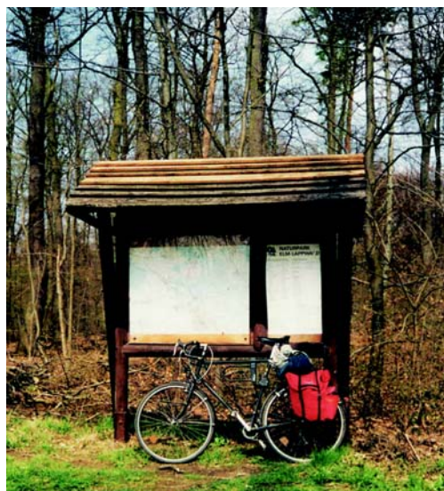
Велодороги дальнего следования, проходящие по интересным природным ландшафтам, особенно привлекательны.

В отдельных регионах уже сформировались успешные схемы сотрудничества (например, в Мюнстерланде, на Дунае, в регионе Одер-Нейсе, на Эльбе и на Везере). В этих местах образовались рабочие группы, состоящие из коммунальных территориальных корпораций и региональных туристических центров. Эти рабочие группы контролируют состояние и рекламируют велодороги дальнего следования, а также содержат центры, куда могут обратиться велотуристы (например, «Дунайская велосипедная дорога» (AG Donauradweg), «Везерский союз» (Weserbund)).