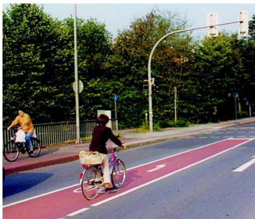
Велосипед оптимально подходит и для повседневных поездок за покупками.

В сфере безопасности Федеральное министерство образования и исследований поддерживает проектную сеть INVENT: вспомогательные системы для транспорта. Подпроект: «Предусмотрительная активная безопасность пешеходов/Защита велосипедистов» посвящен предупреждению и минимизации последствий несчастных случаев с участием незащищенных участников дорожного движения посредством установки датчиков и исполнительных приспособлений. В дальнейшем следует разрабатывать реверсивные, активные бамперные системы, а также активные элементы в зоне капотов и ветровых стекол.