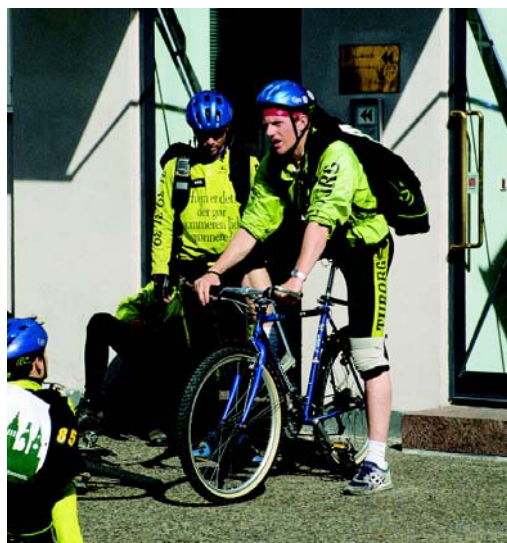
Велокурьерские службы отличаются быстротой и гибкостью.

Следующий сегмент рынка заняли службы велокурьеров. Спектр предложений охватывает курьерские услуги, выемку почты из почтовых ящиков, межрегиональные перевозки и перевозки для больниц. В Кёльне предлагаются перевозки грузов до 300 кг, другие службы предлагают доставку товаров. Решающими доводами в пользу велокурьеров, с точки зрения пользователей, являются быстрота, надежность и гибкость реакции на пожелания потребителей. Сравнение времени доставки у велокурьеров, частных автокурьеров и Швейцарской почтово-курьерской службы (PPT) показало, что требуемое для доставки время у велокурьеров меньше на 20-300%.