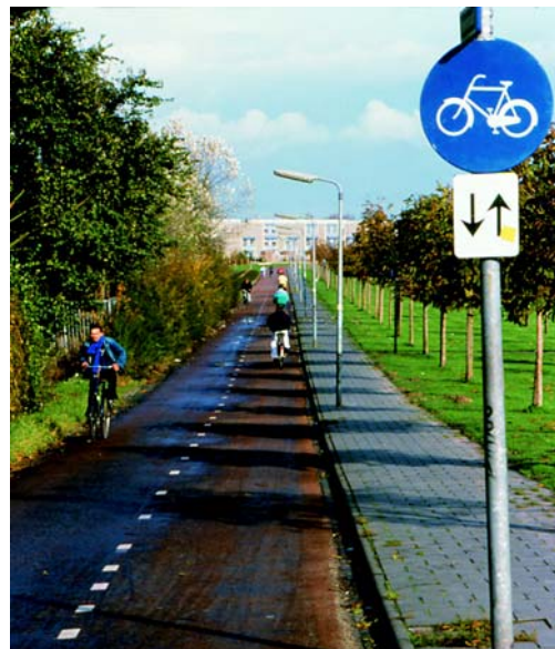
Содействие велосипедному транспорту: важная составная часть общей транспортной системы.

Возможные стратегии решения перечислены в Обзоре 13.