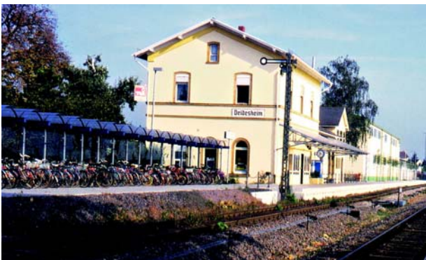
Комплексы для парковки велосипедов – как в Дайдесхайме – облегчают связку видов транспорта.

Провоз велосипедов в средствах местного общественного железнодорожного транспорта зачастую возможен лишь в определенные часы. Отсутствует единая система цен и тарифов. Тарифы изменяются на границах транспортных пространств. Посадка в поезда значительно затруднена за счет недостаточной ширины дверей или низкого расположения платформ.