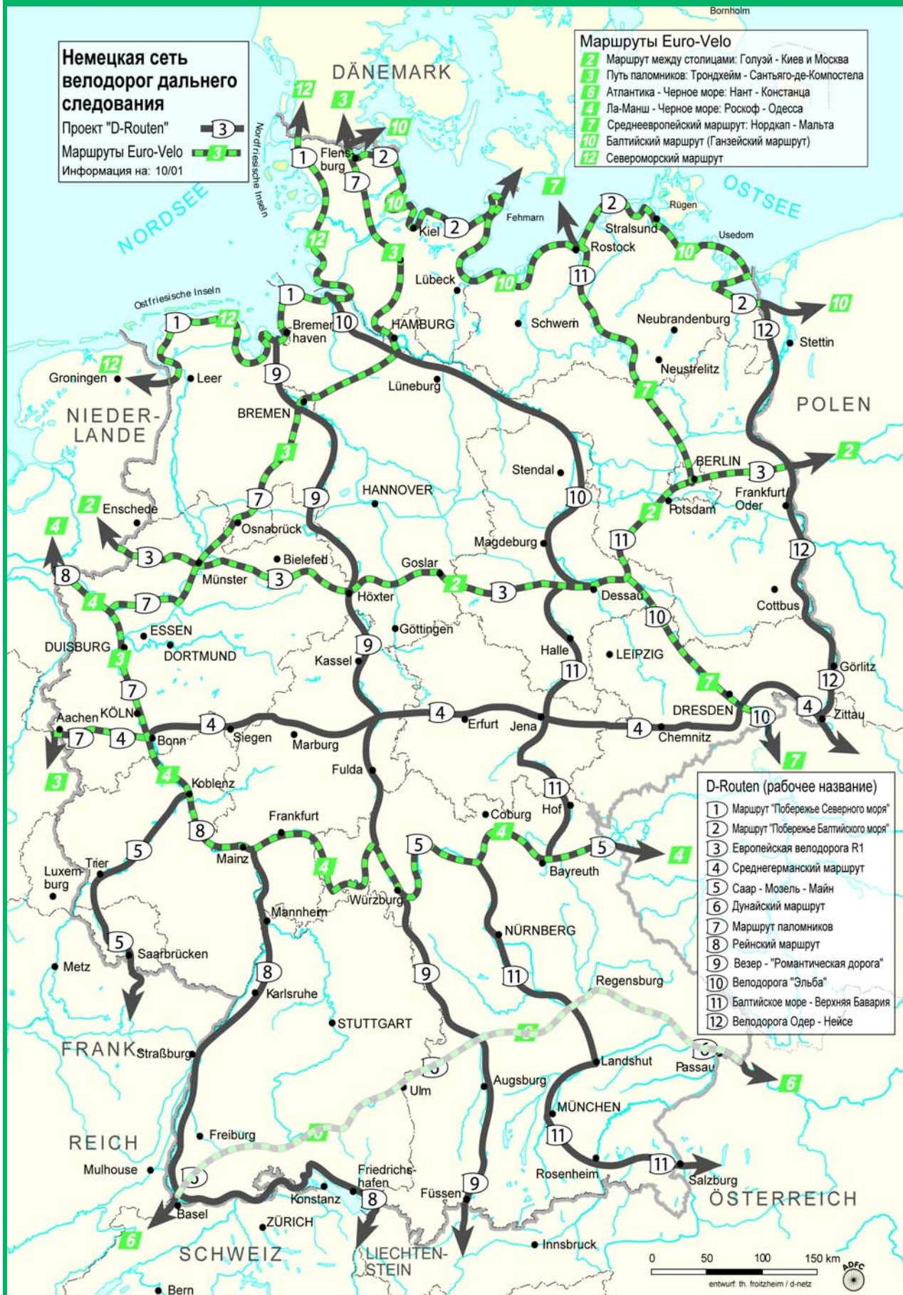
Иллюстрация 4: Сеть велосипедных маршрутов D-Netz