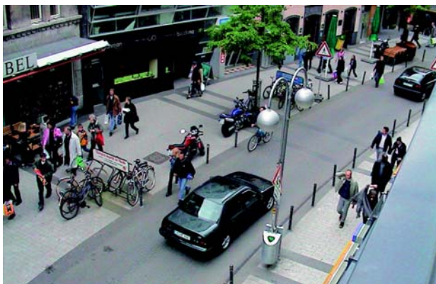
На улице Брайте Штрассе в Кёльне есть место для всех участников дорожного движения.

Федеральные земли и коммуны должны на всех уровнях разработать и реализовать ориентированные на целевые группы информационные стратегии, чтобы устранить разницу в уровнях осведомленности компетентных деятелей, которая на практике зачастую затрудняет реализацию необходимых мероприятий. Соответствующее значение имеют и меры, которые улучшают коммуникацию между деятелями и, таким образом, облегчают и ускоряют процессы согласования решений.