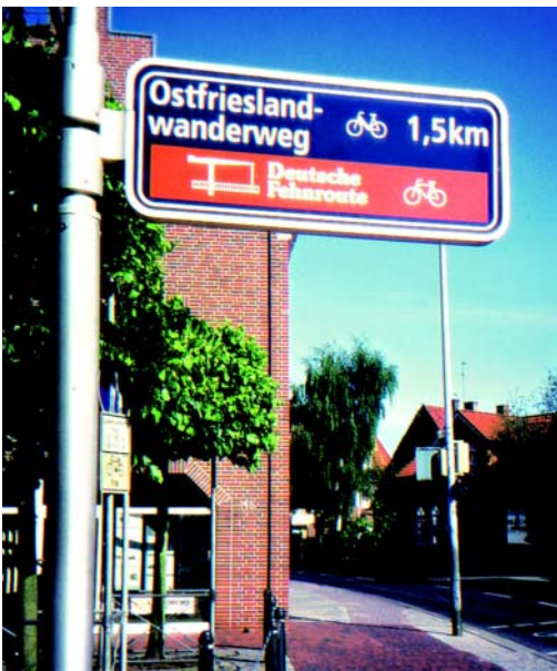
Следовало бы осуществить связь туристических регионов и возможностей велосипедного туризма.

В федеральном бюджете на 2002 год впервые была выделена отдельная статья на строительство и поддержание велосипедных дорог в сфере ответственности федерации в размере 100 миллионов € (глава 1210, статья 746 22). Эта сумма означает удвоение инвестиционных средств по сравнению с предыдущими годами. Таким образом, федерация в рамках своей компетенции вносит вклад в улучшение велотранспортных сетей и